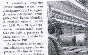
Para 2023, as projeções divergem. A proposta de Orçamento da União prevê crescimento de 2,5%, enquanto as estimativas do Banco Mundial apontam expansão bem menor

Segundo o Banco Mundial, o crescimento do PIB brasileiro deve superar a previsão de 1,5% e chegar a 2,5% até o final do ano. Estimativas estão mais em linha com as previsões do governo