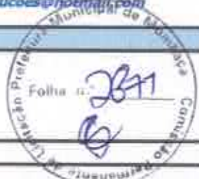
TABELA SEINFRA 027.1 COM DESONERAÇÃO, TABELA SINAPI 2021/11 COM DESONERAÇÃO

OBRA: REFORMA DO MERCADO PÚBLICO PEDRO MARTINS CHAVES EM MOMBAÇA/CE DESCRIÇÃO: REFORMA DO MERCADO PÚBLICO PEDRO MARTINS CHAVES EM MOMBAÇA/CE LOCAL: RUA JOSÉ FRUTUOSO SÂ BENEVIDES, MOMBAÇA/CE. CLIENTE: PREFEITURA MUNICIPAL DE MOMBAÇA/CE