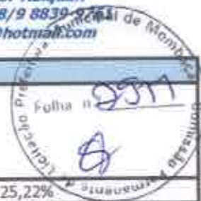
TABELA SEINFRA 027.1 COM DESONERAÇÃO/TABELA SINAPI 2021/12/ COMPOSIÇÃO PRÓPRIAS BDI: 25,22%

OBRA: URBANIZAÇÃO E CONSTRUÇÃO DE PÓRTICO NO ACESSO DO MUNICÍPIO DE MOMBAÇA/CE DESCRIÇÃO: URBANIZAÇÃO E CONSTRUÇÃO DE PÓRTICO NO ACESSO DO MUNICÍPIO DE MOMBAÇA/CE LOCAL: CE-636, MOMBAÇA/CE CLIENTE: PREFEITURA MUNICIPAL DE MOMBAÇA/CE