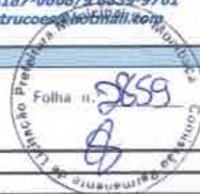
TABELA SEINFRA 027.1 COM DESONERAÇÃO, TABELA SINAPI 2021/11 COM DESONERAÇÃO

OBRA: REFORMA DO MERCADO PÚBLICO PEDRO MARTINS CHAVES EM MOMBAÇA/CE DESCRIÇÃO: REFORMA DO MERCADO PÚBLICO PEDRO MARTINS CHAVES EM MOMBAÇA/CE LOCAL: RUA JOSÉ FRUTUOSO SÁ BENEVIDES, MOMBAÇA/CE CLIENTE: PREFEITURA MUNICIPAL DE MOMBAÇA/CE