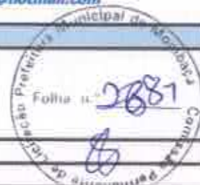
TABELA SEINFRA 027.1 COM DESONERAÇÃO, TABELA SINAPI 2021/11 COM DESONERAÇÃO

OBRA: REFORMA DO MERCADO PÚBLICO PEDRO MARTINS CHAVES EM MOMBAÇA/CE DESCRIÇÃO: REFORMA DO MERCADO PÚBLICO PEDRO MARTINS CHAVES EM MOMBAÇA/CE LOCAL: RUA JOSÉ FRUTUOSO SÁ BENEVIDES, MOMBAÇA/CE CLIENTE: PREFEITURA MUNICIPAL DE MOMBAÇA/CE