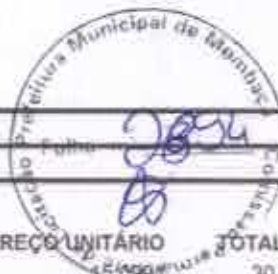
TABELA SEINFRA 027.1 COM DESONERAÇÃO/ TABELA SINAPI 2021/1 COM DESONERAÇÃO BDI: 25,22%

OBRA: REFORMA DA ROTATÓRIA NA AVENIDA BEIRA RIO EM MOMBAÇA/CE DESCRIÇÃO: REFORMA DA ROTATÓRIA NA AVENIDA BEIRA RIO EM MOMBAÇA/CE LOCAL: SEDE, MOMBAÇA/CE CLIENTE: PREFEITURA MUNICIPAL DE MOMBAÇA/CE