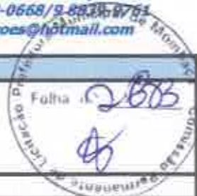
TABELA SEINFRA 027.1 COM DESONERAÇÃO, TABELA SINAPI 2021/11 COM DESONERAÇÃO