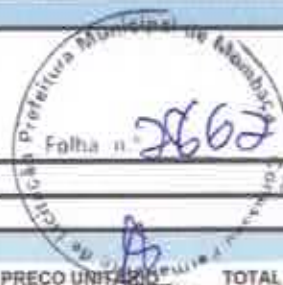
TABELA SEINFRA 027.1 COM DESONERAÇÃO, TABELA SINAPI 2021/11 COM DESONERAÇÃO

OBRA: REFORMA DO MERCADO PÚBLICO PEDRO MARTINS CHAVES EM MOMBAÇA/CE DESCRIÇÃO: REFORMA DO MERCADO PÚBLICO PEDRO MARTINS CHAVES EM MOMBAÇA/CE LOCAL: RUA JOSÉ FRUTUOSO SÁ BENEVIDES, MOMBAÇA/CE. CLIENTE: PREFEITURA MUNICIPAL DE MOMBAÇA/CE