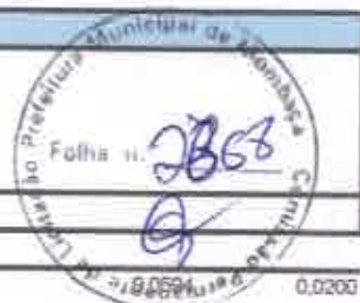
TABELA SEINFRA 027.1 COM DESONERAÇÃO, TABELA SINAPI 2021/11 COM DESONERAÇÃO

OBRA: REFORMA DO MERCADO PÚBLICO PEDRO MARTINS CHAVES EM MOMBAÇA/CE DESCRIÇÃO: REFORMA DO MERCADO PÚBLICO PEDRO MARTINS CHAVES EM MOMBAÇA/CE LOCAL: RUA JOSÉ FRUTUOSO SÁ BENEVIDES, MOMBAÇA/CE. CLIENTE: PREFEITURA MUNICIPAL DE MOMBAÇA/CE.