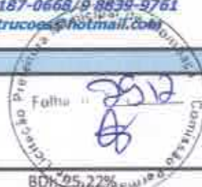
TABELA SEINFRA 027.1 COM DEBONERAÇÃO/TABELA SINAPI 2021/12/ COMPOSIÇÃO PRÓPRIAS

OBRA: URBANIZAÇÃO E CONSTRUÇÃO DE PÓRTICO NO ACESSO DO MUNICÍPIO DE MOMBAÇA/CE DESCRIÇÃO: URBANIZAÇÃO E CONSTRUÇÃO DE PÓRTICO NO ACESSO DO MUNICÍPIO DE MOMBAÇA/CE LOCAL: CE-636, MOMBAÇA/CE CLIENTE: PREFEITURA MUNICIPAL DE MOMBAÇA/CE